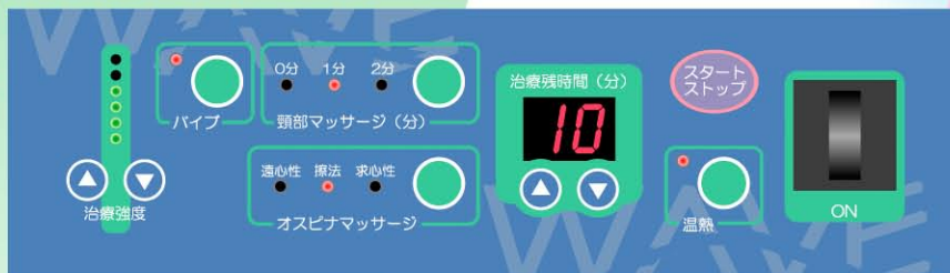
バイブ機能搭載機の操作パネルです。

治療内容の設定、治療残時間表示や治療強度表示など、使い勝手と見やすさを心得た操作パネルです。